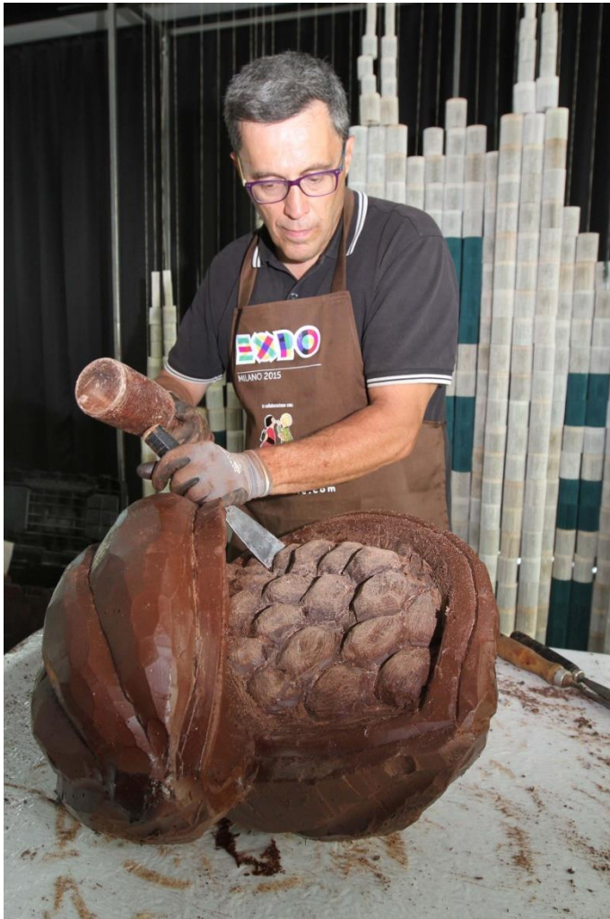
Animation de sculpture du chocolat.