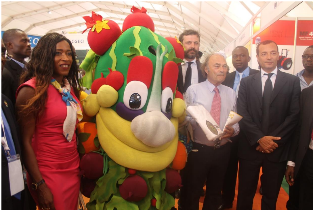
FOODY et la Délégation italienne en compagnie de l'Ambassadeur d'Italie en Côte d'Ivoire et, le Consul Honoraire de Côte d'Ivoire à Turin (Italie), (entre l'Ambassadeur et FOODY) (la délégation Italienne) visitent les stands au S.A.R.A.