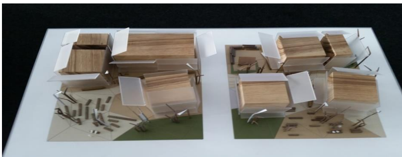
Maquette du Cluster Cacao et Chocolat.