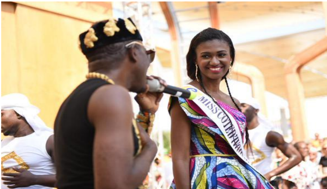
Bienvenue à la Miss Côte d'Ivoire, à l'Expo Milan 2015.