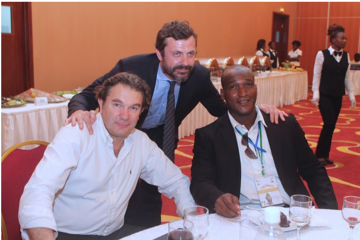
La délégation Italienne au Diner Gala.