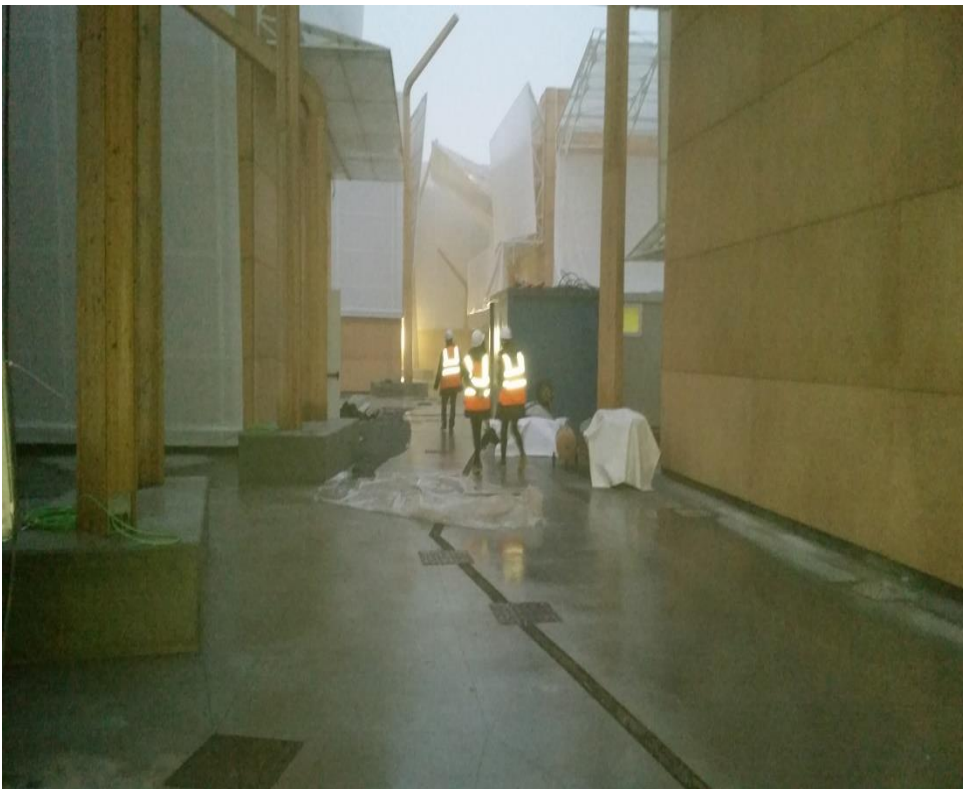
La représentante et l'architecte des Clusters à l'Expo Milan 2015.