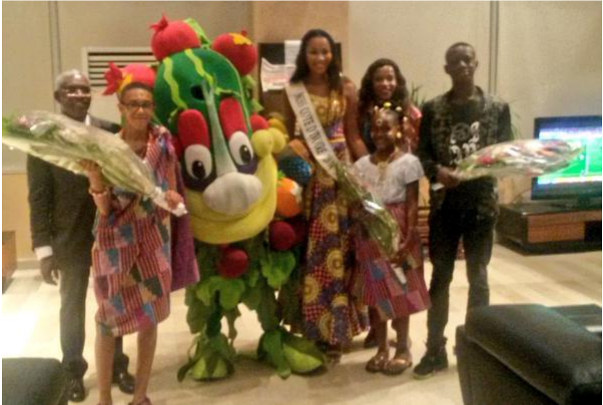
La Miss de Côte d'Ivoire 2014-2015 dit Akwaba à FOODY à l'aéroport internationale d'Abidjan, à l'espace VIP.