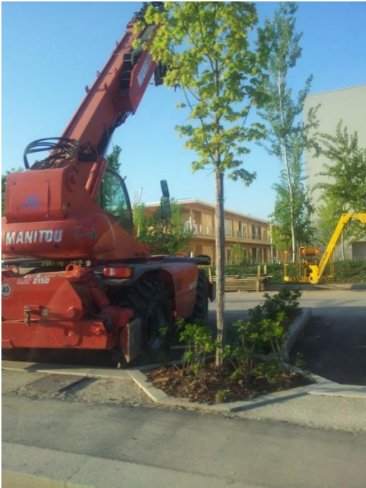
Avant l'ouverture d'Expo Milan, le 25 Avril 2015.