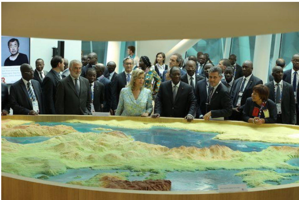
La visite du Pavillon Italien.